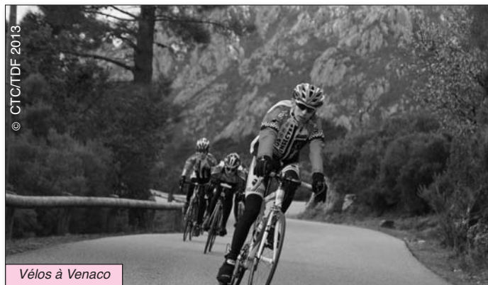
Vélos à Venaco