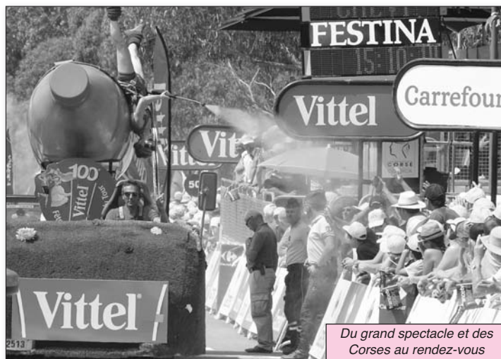
Du grand spectacle et des Corses au rendez-vous

Sans mettre de côté l'exploit sportif auquel contribue largement, par sa rudesse et les difficultés qu'elle a imposées sans ménagement aux coureurs, la Corse ressort, après 3 jours d'effervescence, comme la grande vedette de ce lancement du 100 ème Tour de France. Retour en mots et en images sur les trois étapes qu'elle a rendues historiques.