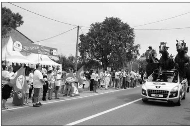
Le passage du peloton