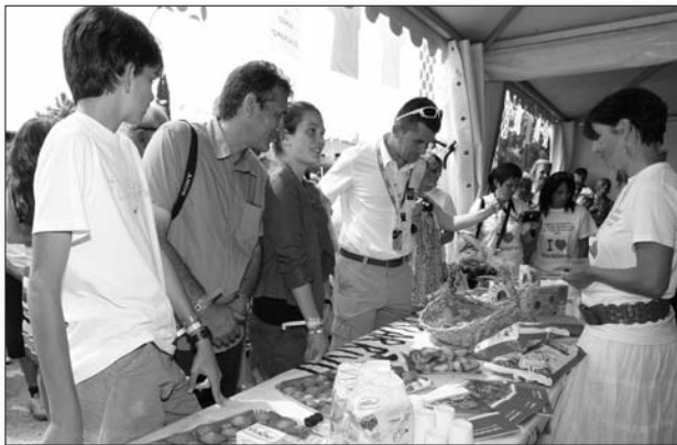
Les membres du jury invités à déguster