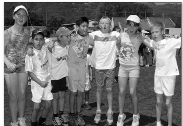
La joie des écoliers

Un grand moment de sportivité et d'amitié qui fait l'unanimité et bénéficie du soutien du Conseil Général de la Haute-Corse , du magasin Casino de Moriani , et des eaux de Zilia .