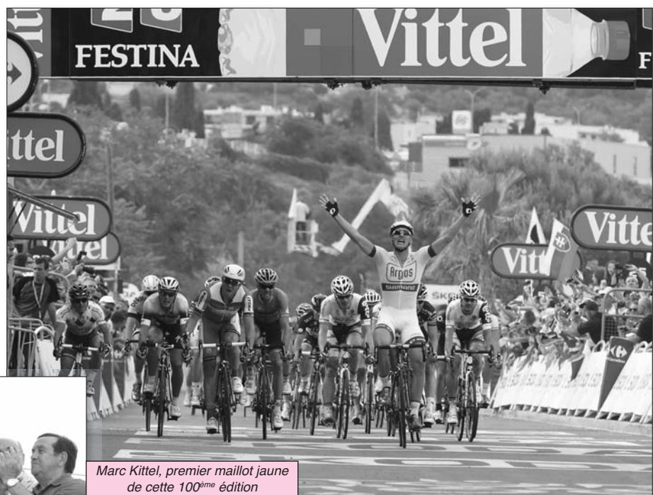
Marc Kittel, premier maillot jaune de cette 100 ème édition