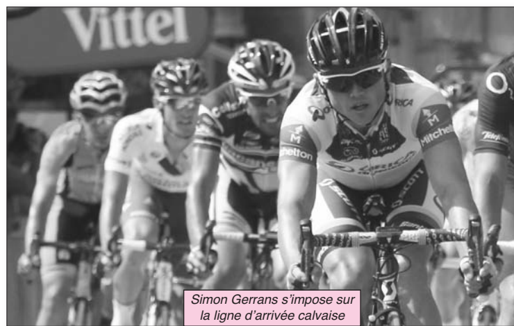
Simon Gerrans s'impose sur la ligne d'arrivée calvaïse

On le savait : cette dernière étape en Corse était annoncée comme l'une des plus difficiles du Tour . Elle fut courte mais intense. De nombreux cols et montées se sont succédé pour favoriser les puncheurs. Simon Gerrans a su éviter les pièges de nos routes torturées s'imposer sur la ligne d'arrivée. En ce 1 er juillet, pas un kilomètre de plat. Jetant un regard technique sur l'épreuve, Dominique Bozzi a bien souligné la spécificité de cette ultime étape en Corse : « La succession de 5 cols et les routes sinueuses ont forcé le peloton à s'étendre au maximum. Si les favoris se jaugent d'habitude pendant une semaine, cette fois-ci ils ont été obligés de se dévoiler dès le 3 ème jour. » Et de répéter : « Le Tour ne s'est pas gagné en Corse mais pour certains il est déjà perdu. »