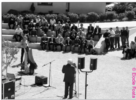
Une enceinte moderne à l'image des amphithéâtres antiques

119 M€ et 115 M€ : c'est ce que pèsent, respectivement en termes de dépenses et de recettes, les réalisations, toutes sections confondues, de la Ville d'Ajaccio , en 2012