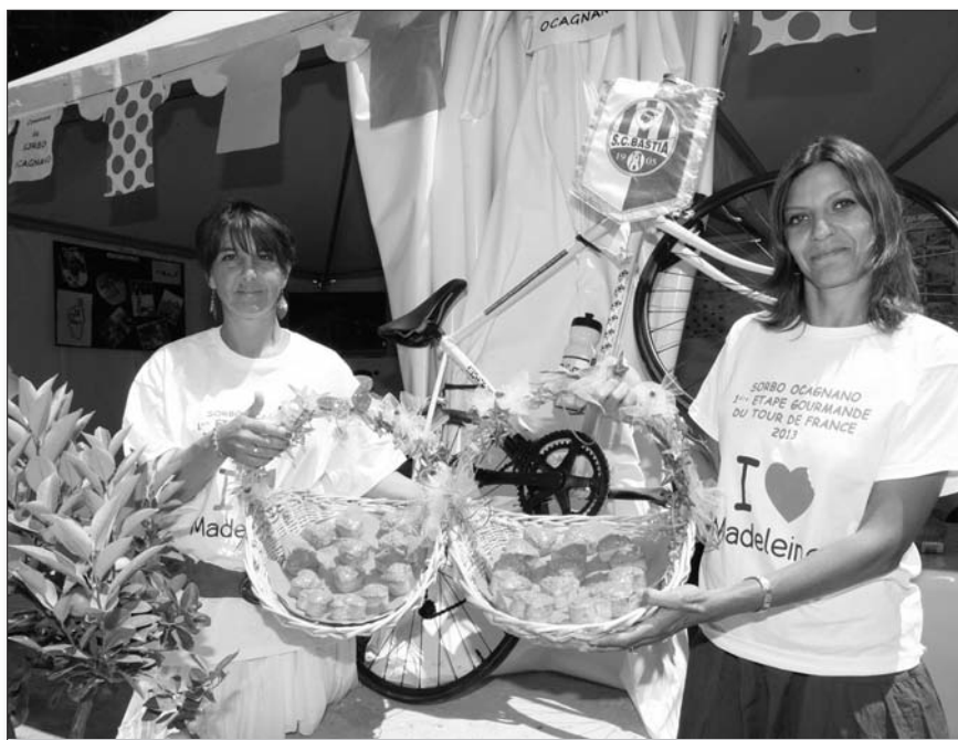
La « madeleine » surbinca !