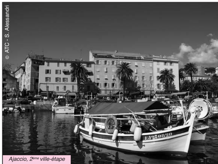
Ajaccio, 2 ème ville-étape