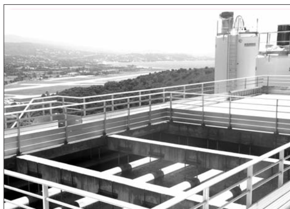
L'Usine de production d'eau potable de la Confina, sur les hauteurs d'Ajaccio

Ce 25 juin, la CAPA organisait une conférence d'information et de sensibilisation pour faire adhérer l'ensemble des élus, agents communautaires et communaux au plan de réduction des prélèvements en eau (PRPE).