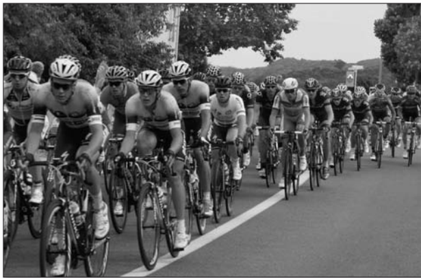
Le passage du peloton