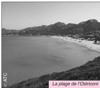
La plage de l'Ostriconi