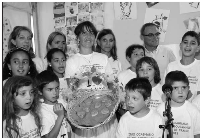
Bernard Hinault accueilli sous le chapiteau !

Plus qu'un simple concours culinaire, ce Grand Prix est une grande fête conviviale qui met à l'honneur une commune et ses habitants. Les 27 enfants de l'école primaire ont joué leur rôle en interprétant des chants corses accompagnés par le chanteur Dédé Sekli sur le stand de dégustation, décoré et animé avec grand soin. La mobilisation et l'animation de la commune seront aussi récompensées par St