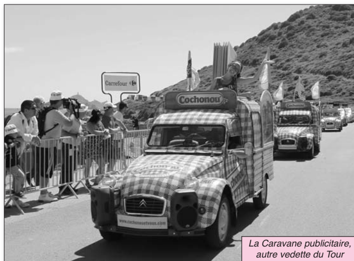
La Caravane publicitaire, autre vedette du Tour

Sans mettre de côté l'exploit sportif auquel contribue largement, par sa rudesse et les difficultés qu'elle a imposées sans ménagement aux coureurs, la Corse ressort, après 3 jours d'effervescence, comme la grande vedette de ce lancement du 100 ème Tour de France. Retour en mots et en images sur les trois étapes qu'elle a rendues historiques.