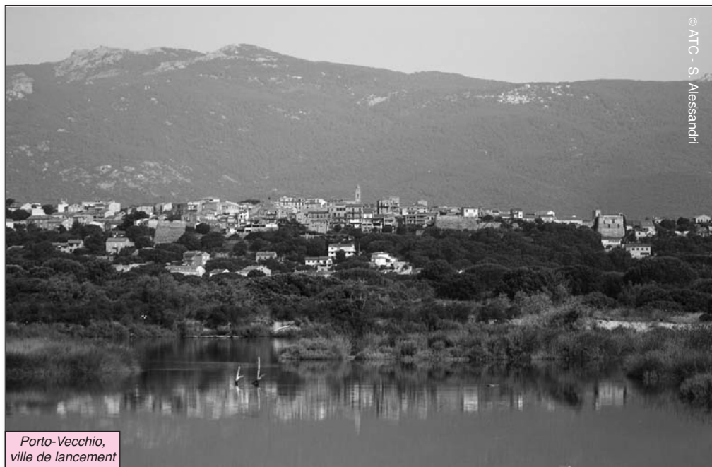
Porto-Vecchio, ville de lancement

Cette première étape Porto-Vecchio/Bastia a donné le ton : des paysages somptueux ont défilé sous les yeux de plus de 3 milliards de spectateurs. Les merveilles des Réserves Naturelles des Tre Padule de Suartone et les falaises vertigineuses de Bonifacio ont ouvert le bal dès les premiers kilomètres. Les plages et les criques, les vestiges romains de Mariana et les étangs d' Urbino et Biguglia ont ensuite mené la danse. « Un Grand Départ qui a été une grande fierté pour la Corse et ses 310 000 habitants qui se préparaient depuis plus d'un an », a rappelé le Président du Conseil Exécutif de Corse, Paul Giacobbi . Pour la première fois, le Tour a traversé notre île. Et pour la première fois, les 190 pays qui peuvent le suivre ont eu les yeux fixés sur l'île. « On attendait du spectacle. On l'a eu ! », s'est d'emblée exclamé l'ancien coureur cycliste pro-