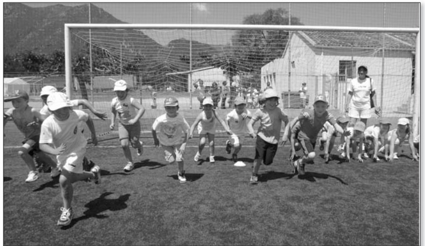
C'est parti pour les 22 èmes Olympiades de Moriani-Plage !

A quelques jours de la fin de l'année scolaire, les traditionnelles Olympiades de Moriani-Plage ont donné rendez-vous à la jeunesse, réunissant sur le stade Jean Olivesi pas moins de 340 enfants des écoles primaires de San Nicolao, San Giulianu, Santa Maria Poghju et Santa Lucia di Moriani. Une journée placée sous le signe du sport, du partage et du loisir, qui fait figure de grande kermesse sportive de fin d'année.