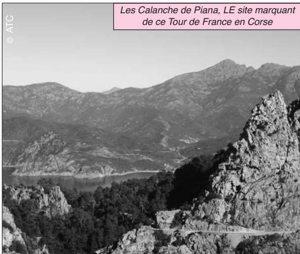
Les Calanche de Piana, LE site marquant de ce Tour de France en Corse